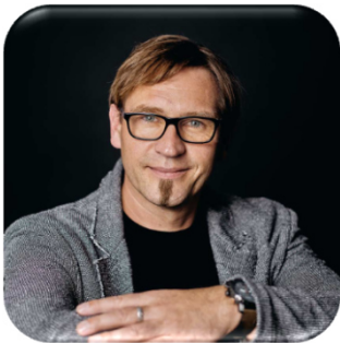
Carsten Graf Bürgermeister Leisnig