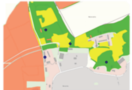
Standorteynung Wald für Windenergieanlagen nach § 20 Abs. 3 SächsLPIG

Für die Auswahl unserer Standorte folgen wir den klaren Richtlinien des § 20 Abs. 3 des Sächsischen Landesplanungsgesetzes (SächsLPIG). Eine Bewertung geschieht im Rahmen einer speziellen Waldfunktionenkartierung gemäß § 6a SächsWaldG. Nur die Flächen, die den strengen forst-, natur- und wasserrechtlichen Kriterien entsprechen, werden als geeignete Standorte eingestuft. Mit dieser sorgfältigen Selektion stellen wir sicher, dass unsere Windenergie-Anlagen nicht nur grüne Energie erzeugen, sondern auch die vielfältigen Funktionen der bestehenden Nutzung respektieren und erhalten.